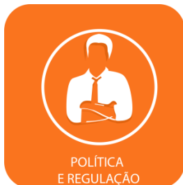
POLÍTICA E REGULÇÃO

Com a conclusão da UHE Santo Antônio do Jari, a EDP volta os olhares para a conclusão da UHE Cachoeira Caldeirão (AP - 219 MW). Em dezembro de 2014, 68,7% da obra estava realizada, tendo desembolsado 55% do investimento de R$ 1,2 bilhão. Em dezembro, houve o desembolso do financiamento do Banco Nacional do Desenvolvimento Econômico e Social no valor de R$ 300 milhões, além da emissão de R$ 157 milhões em debêntures. A outra usina em construção da EDP, a UHE São Manoel (MT - 700 MW) está em fase inicial de construção, tendo executado, até dezembro de 2014, R$ 125,4 milhões de um investimento de R$ 2,7 bilhões. A UTE Pecém (CE - 720 MW) também vai receber atenção especial da empresa. Dona de metade da usina, a EDP comprou a outra parte da Eneva.